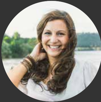
Karin Haselsteiner FOTOGRAFIN